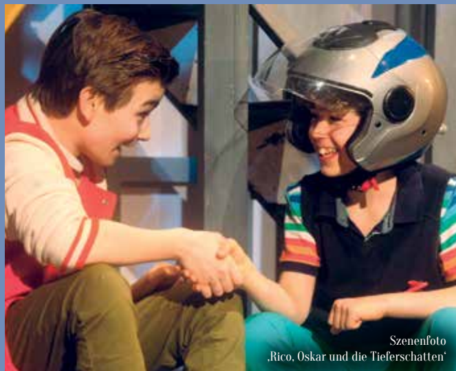
Szenenfoto 'Rico, Oskar und die Tieferschatten'