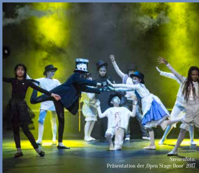
Szenenfoto: Präsentation der ‚Open Stage Door‘ 2017

*Die mit einem ‚d‘ gekennzeichneten Kurse finden im Ortszentrum Dottendorf statt.