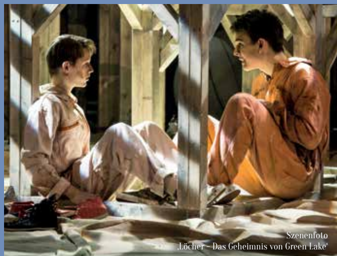
Szenenfoto 'Löcher – Das Geheimnis von Green Lake'

Alle Projektkurse umfassen 32 Termine und finden in den Schulferien nicht statt. In den angegebenen Kurszeiträumen sind teilweise Reservetermine enthalten.